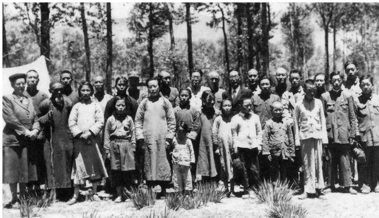
Alcune delle trentacinque persone che furono battezzate nella stazione missionaria di Plymire.