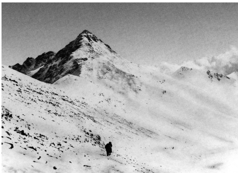
Salire verso la vetta.