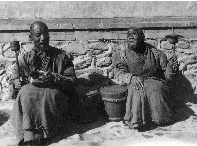
Il monaco tibetano cieco, sulla destra, rifiutò di vendere la sua ruota della preghiera.